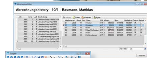
Übersicht über alle gebuchten Lohnläufe.